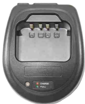
Быстрое зарядное устройство